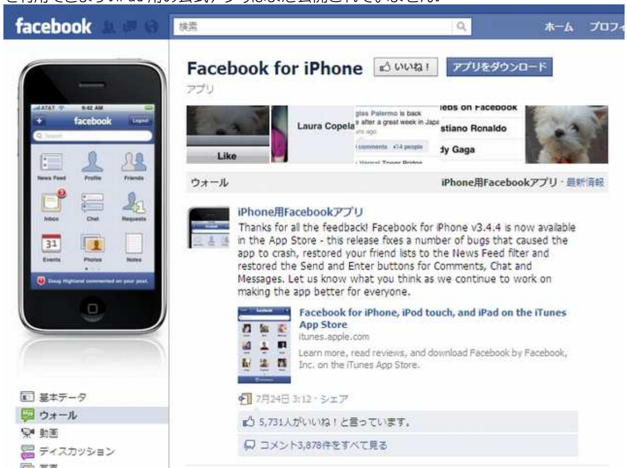
【Facebook for iPhone】

スマートフォンでは、iPhone用の「Facebook for iPhone」やAndroid用の「Facebook for Android」を利用できます。iPad用の公式アプリはまだ公開されていません。