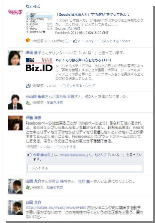
【「ニュースフィード」】

時系列で友達の情報をすべて表示する機能のほかに、「ハイライト」という、盛り上がっている投稿(コメントや「いいね！」)が多くついている投稿や、Facebook 上で頻繁にやり取りをしている友達の投稿)だけを見せてくれる機能もあります。Twitter では「フォロー数が増えて、すべての情報を見られない」という声が出てくるようになってきましたが、Facebook ではこの「ハイライト」機能によって情報を絞り込んで見ることができます。