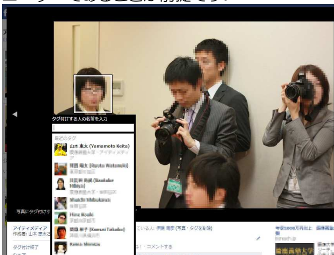
【タグ付けの例（モザイク処理をしています）】

集合写真を撮ったら、忘れないうちに写っている人の顔に名前をタグ付けしておけば OK。タグからその人のプロフィールにたどり着けるので、どういう経歴の人でどういう趣味を持っているのかなど詳しいことが分かります。「また次に会ったら親しくなろう」ではなく、まだ知り合ったばかりの人でも深く相手を知ることができるのです。もちろん、これはお互いが Facebook のユーザーであることが前提です。